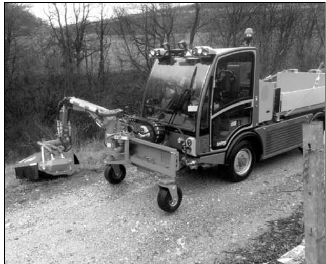
Böschungsmäher im Einsatz

einsetzbar (Böschungsmäher, Schneeräumungsfahrzeug und Salzer). Daneben ist auch der Transport von schweren Gegenständen und Unterhaltsarbeiten an schmalen Verbindungswegen möglich. Ein grosser Vorteil ist ebenfalls, dass diesem Fahrzeug die Aufbaugeräte dank dem «plugandplay»-System mit nur wenig Aufwand aufgesetzt werden können.