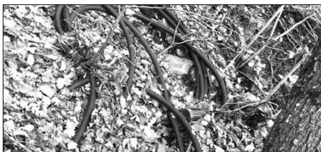
Abfallentsorgung der etwas anderen Art in der freien Natur

Immer wieder muss von der Dorfgemeinschaft festgestellt werden, dass Unrat und Sperrgut unsachgemäss entsorgt wird. Die Gegenstände werden durch unsere Werkhofmitarbeiter eingesammelt und ordnungsgemäss an den dafür vorgesehenen Sammelstellen abgegeben. Das Bedauerliche daran ist es, dass durch die Gleichgültigkeit einzelner Mitbürger oder auswärtiger Besucher unserer Gemeinde, die Kasse der Allgemeinheit für die Beseitigung und Fremdkosten zur Entsorgung der Materialien aufkommen muss. Die Gemeindeverwaltung versucht die Missetäter aufzuspüren und geht auch Meldungen aus der Bevölkerung sehr gerne nach.