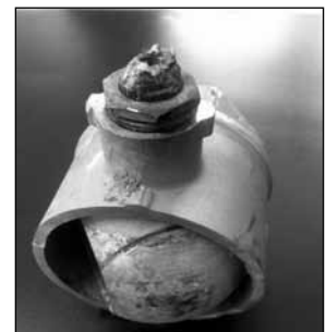
Ein mittels Rohrzange beschädigter Kugelschieber

Nichts ist für die Ewigkeit gebaut. So auch nicht unser Bewässerungsnetz für die Kulturen und Gärten. Die Gemeinde versucht Schäden jeweils rasch zu beheben um einen reibungslosen Betrieb der Rebbewässerungsanlagen gewährleisten zu können. Immer wieder stellen aber unsere Werkhofmitarbeiter fest, dass durch falsche Handhabung z. B. mittels Rohrzangen die Kugelschieber Schaden nehmen und so nicht mehr verwendbar sind. Es handelt sich dabei nicht mehr um normale Verschleissanzeichen, sondern um einen mutwilligen Schaden. Die Gemeinde appelliert an die Nutzer der Rebbewässerungsanlagen, sorgsam mit den Materialien umzugehen und falls Schwierigkeiten beim Öffnen oder Schliessen des Schiebers entstehen, direkt die Werkhof-Pikettmannschaft zu kontaktieren, damit unser Mitarbeiter Ihnen zur Hilfe kommen kann.