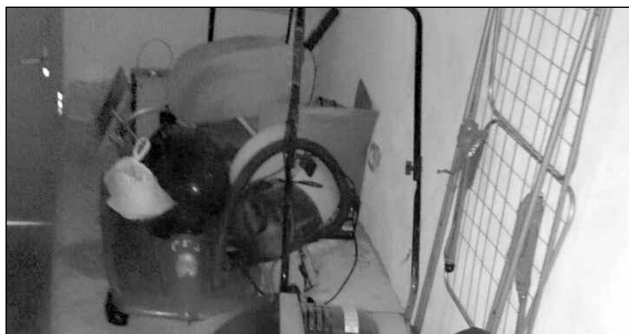
Unsachgemässe Sperrmüllentsorgung in der Pfarrscheune